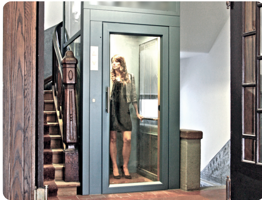
Einflügelige, einseitig öffnende, selbstschließende Drehtür mit verdeckten Bändern